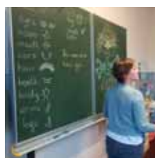
Spiel & Spaß: Englisch