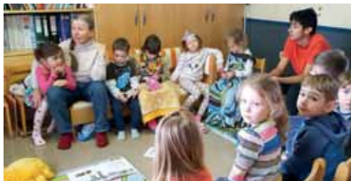
Eltern & Großeltern lesen uns vor im Kindergarten