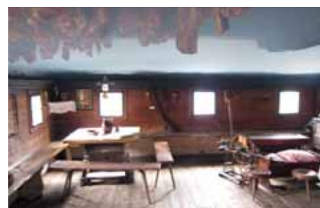
Rauchstubenhaus in Weiz