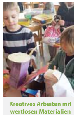
Kreatives Arbeiten mit wertlosen Materialien