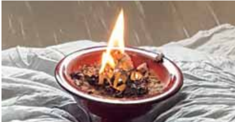
Der Fasching ist vorbei, wir verbrennen Wurf-schlangen und Palmbüsche

Schönen Frühling wünschen die Kinder und das Team des Kindergarten Söding.