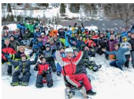
Rodeln der Feuerwehrjugend