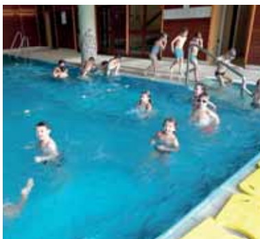
Schwimmkurs der 1. Klassen