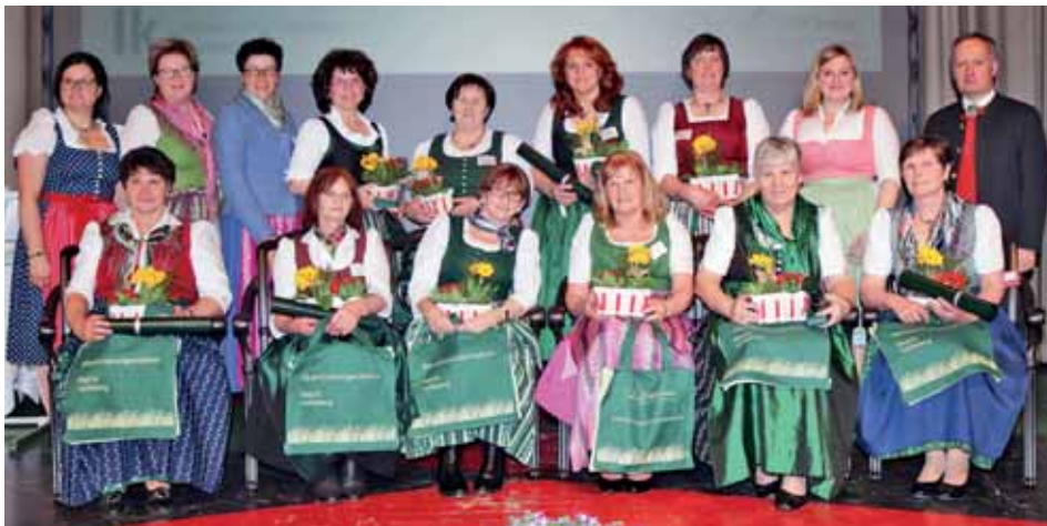
Bezirksbäuerinnentag am 7. März 2018