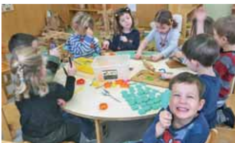
Wir machen uns unsere eigene Knetmasse und haben einen riesen Spaß damit