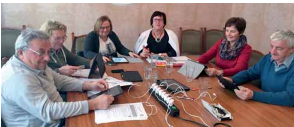
Tablet-Kurs in der Bürgerservicestelle Sankt Johann