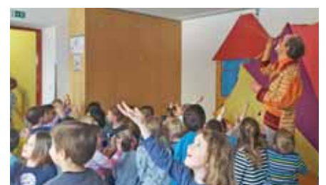
Clown Jako im Kindergarten