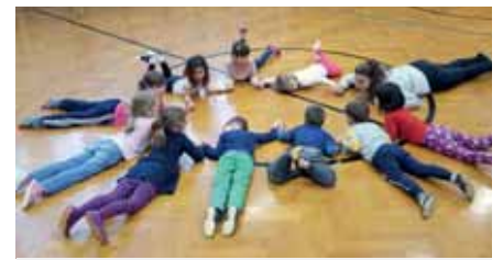
Turnen im großen Turnsaal