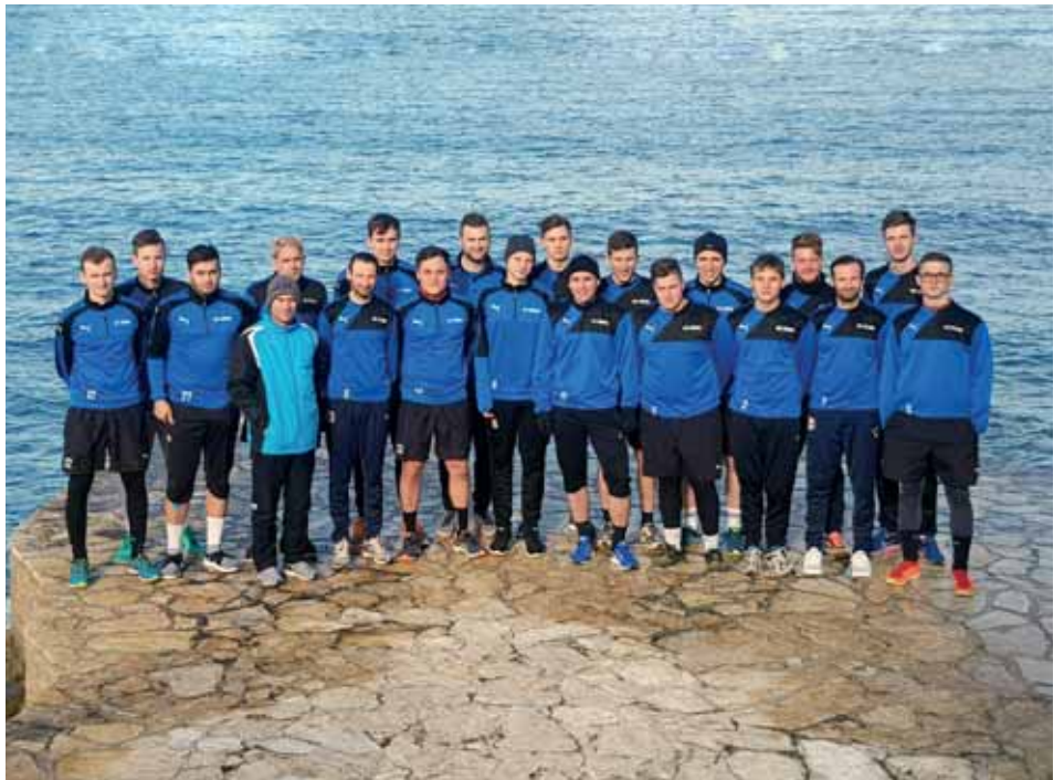
Trainingslager in Porec