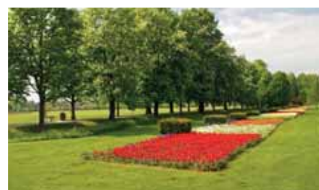
Tulpenblüte in Slowenien