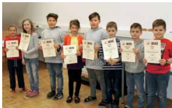
Wettbewerb Känguru der Mathematik