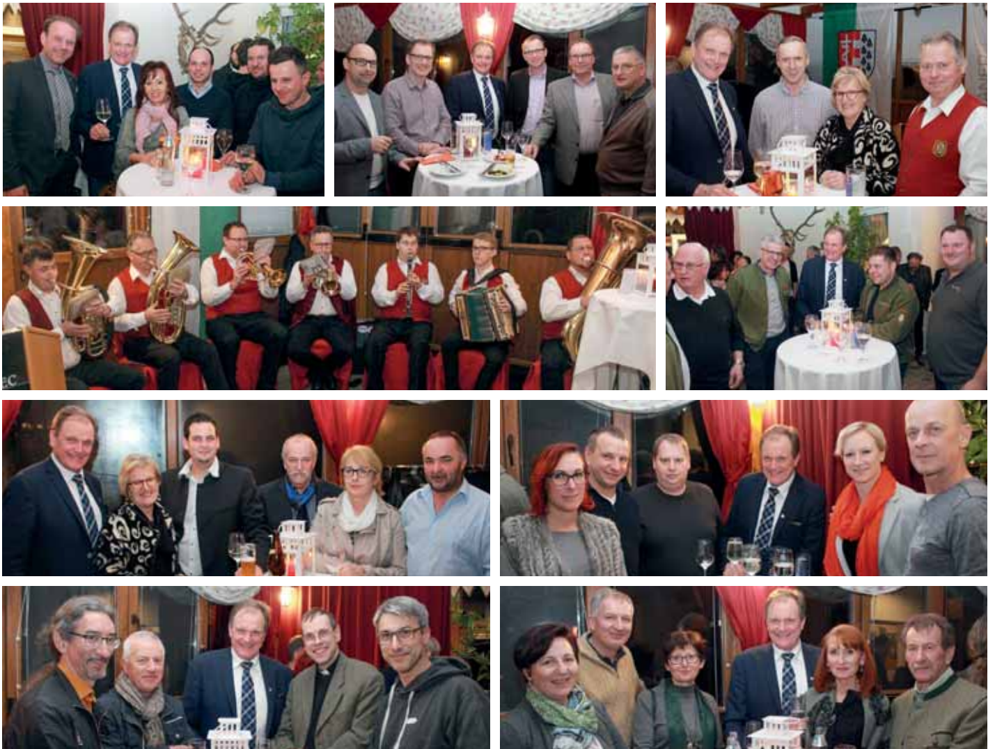
Neujahrsempfang – 24.1.2018