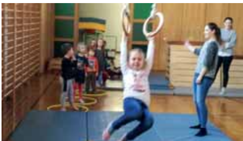
Wir turnen mit Geräten, was für ein Spaß