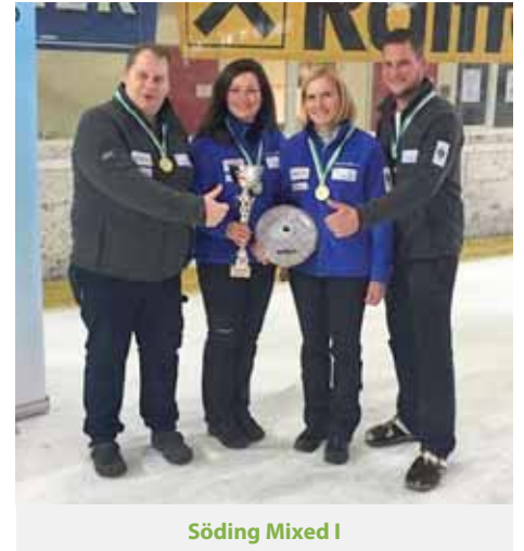
Söding Mixed I