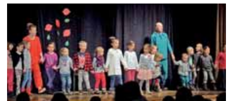
Ausflug nach Köflach: Die Geggis