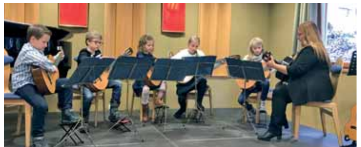
Klassik und Kuchen