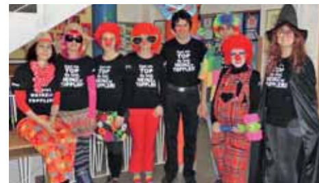
Faschingsfest in der Schule