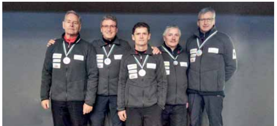
Gebietsmeisterschaft II – Senioren