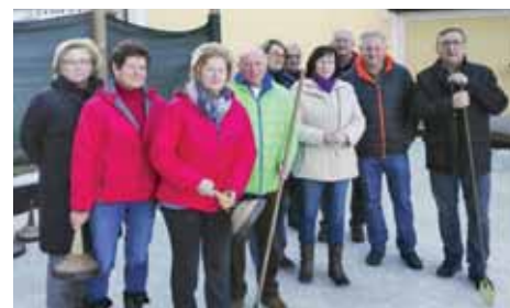
Eisstockschießen am Geländer Wallner Mühle

Nicht hinterm Ofen hocken, sondern raus in die Natur. Das ist das Motto der Pensionistinnen und Pensionisten des PV Ligist-Krottendorf-St. Johann. Kaum hatten die "Eismeister" des ESV Krottendorf am Gelände der Wallner Mühle ein Eis fabriziert, waren die „Pensis“ schon regelmäßig zum Training am Eis. Immerhin galt es beim Gemeindefturnier gute Figur zu machen. Mit einem 5. Platz hat sich die Moarschaft des PV wacker geschlagen. Und für jene Frischluftfanatiker, die beim Eisschützenturnier nicht dabei waren, hat es eine Winterwanderung gegeben. Die Winterwanderung ist schon traditionell der Beginn der Wandersaison. Heuer wurde im