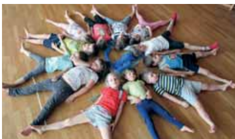
Die letzte Schneeflocke

In kleinen Schritten wird es Frühling und die langen Winterabende sind jetzt vorbei. Wir haben Osterschmuck in verschiedensten Varianten hergestellt, die Kinder haben die Möglichkeit Eier zu gestalten, Osternester zu fertigen und andere Ostersymbole herzustellen. Wir wünschen allen Familien eine wunderbare Frühlingszeit!