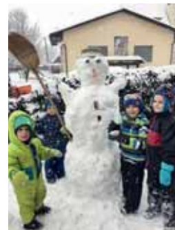
Spaß im Schnee