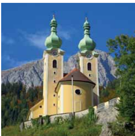
Antoniuskirche in Radmer

Am 29. Mai fahren die SeniorInnen nach Wien zur Barbara Karlich Show in das ORF-Zentrum. Wir sind Publikumsgäste und sind bei drei Aufzeichnungen dabei.