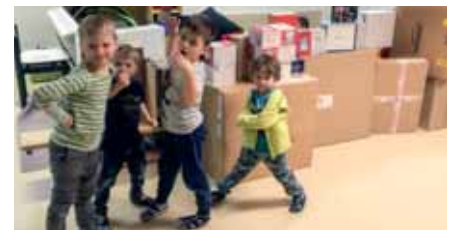
Schachteln als Bausteine, wir bauen ein Haus