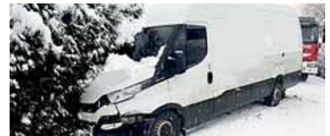
3-Achsiger LKW kollidierte mit Klein-LKW