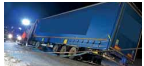
LKW rutschte in den Straßengraben