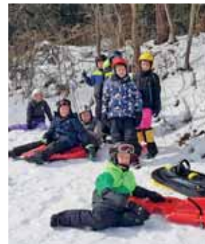
Wintersport – Spaß im Schnee