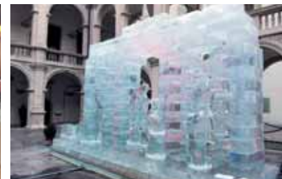
Eiskrippe am Weihnachtsmarkt Graz

Krippenausstellung ins Zisterzienserstift Rein. Danach wurden der Weihnachtsmarkt in Graz und die Eiskrippe besucht. Den Tag ließen die Pensionistinnen und Pensionisten in einem Buschenschank gemütlich ausklingen.