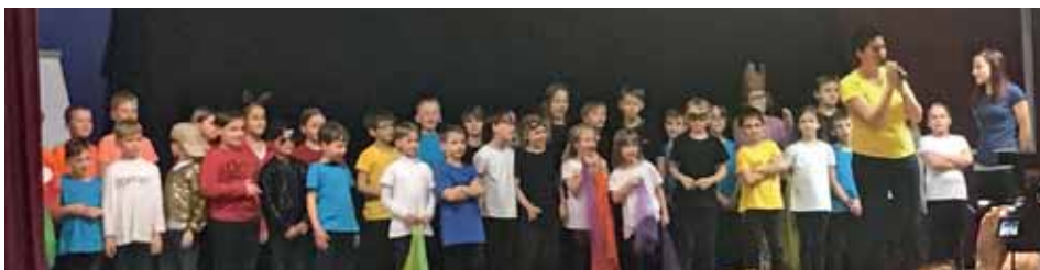
Theaterpädagogik – Aufführung im Festsaal Söding