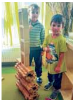
Stolze Bauherren präsentieren ihre Gebäude