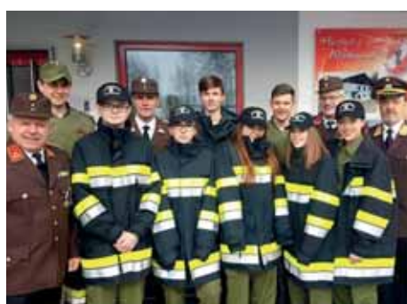
Wissenstest der Feuerwehrjugend