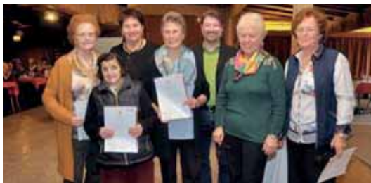
Ehrungen bei der Weihnachtsfeier

Die allerletzte Ausfahrt führte heuer zur