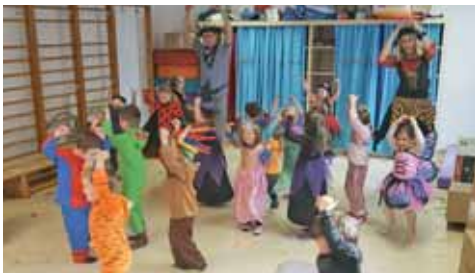
Wir feiern Fasching