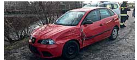
Zusammenstoß zweier PKW in Hallersdorf

Am 12.2.2018 um 8:26 Uhr wurde die FF Hallersdorf zu einem Verkehrsunfall in Hallersdorf alarmiert. Ein 3-Achsiger LKW kollidierte aufgrund der schlechten Witterungsverhältnisse mit einem Klein-LKW der in Folge in eine Hecke geschleudert wurde. Nach dem Erkunden der Lage durch Einsatzleiter HBI Johann Tizaj wurde der Klein-LKW geborgen und die Unfallstelle gereinigt und freigegeben werden. Nach ca. 1 Stunde wurde der Einsatz beendet.