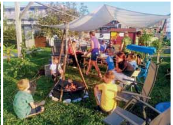
Steckerlbrot braten und Würstel essen.