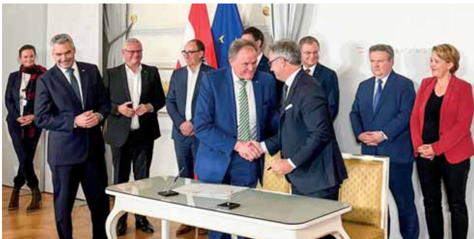
Das Paktum zum neuen Finanzausgleich wurde von den Vertretern des Bundes, der Länder und der Gemeinden unterzeichnet.