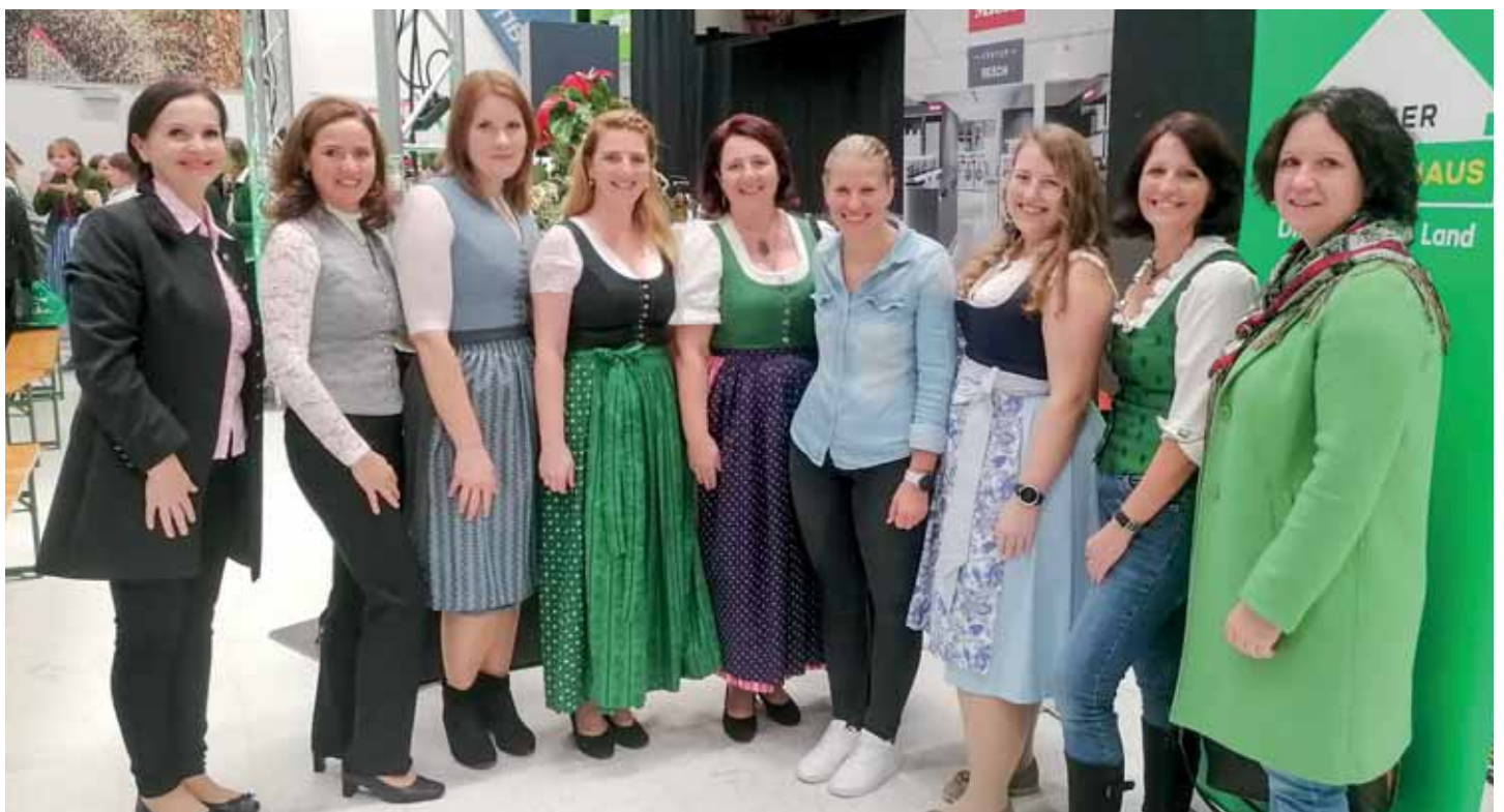
„Ladies Night“ am 16.11.2023 im Lagerhaus Voitsberg.