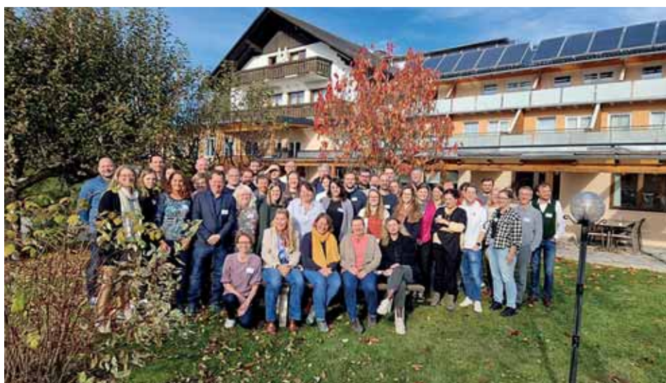
KLAR! Fachveranstaltung in Semriach.

Weitere Aktivitäten werden 2024 in unseren KLAR! Gemeinden stattfinden, so auch weitere Veranstaltungen zur Pflege von Streuobstbäumen und der Verarbeitung des anfallenden Obstes.