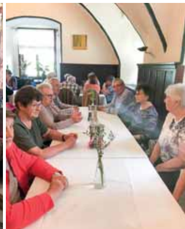
Abschlussfahrt 2023, Sankt Lamprecht.

teiligen sich sehr gerne an diesem Treffen. Das hervorragende Essen und bei bester Stimmung genießen die Damen und Herren die Mittags- und Nachmittagsstunden, manchmal sogar noch Abendstunden. Im März nehmen wir Abstand von Veranstaltungen, weil in dieses Monat die Ostern hineinfallen.