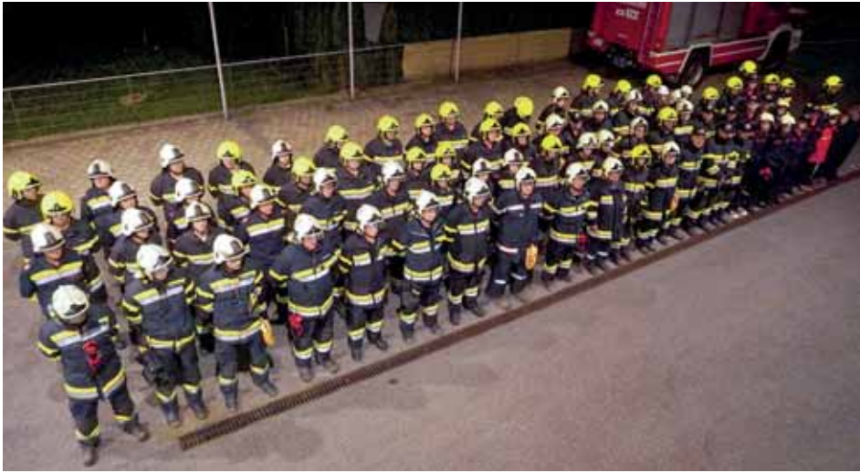
Gemeinsame Übung der drei Feuerwehren Hallersdorf, Köppling und Söding.

Vor dem Gemeindeamt wurde von der Fa. Geminfo.app durch Firmensponsoring ein Touchscreen-Infoterminal errichtet, wo Sie die aktuellen Gemeindeformationen, aber auch die von der Lipizzanerheimat abrufen können.