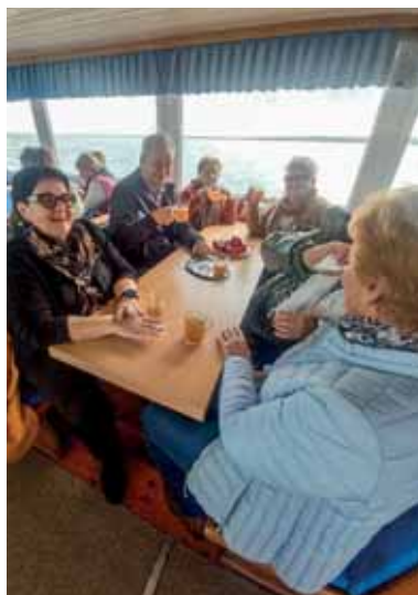
Am Schiff über den Neusiedlersee.

Im beheizten Schiff ging es über den Neusiedlersee . Eine Weihnachtsgeschichte und Adventlieder stimmten die Gruppe auf die bevorstehende Zeit ein. Mit Punsch und Prosecco konnten die Pensionist:innen ihren Blick über den mystischen Neusiedlersee schweifen lassen. Der anschließende Besuch der Ruster Adventmeile hat sich gelohnt. Die vielen kleinen Geschäfte boten weihnachtliches Kunsthandwerk an. Ein Glühwein bei einem der vielen Stände oder der Besuch des Haydnkellers krönte den Ausflug.