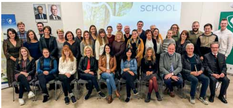
Teilnehmer:innen der Uraufführung.

Ziel war es das Thema Anpassung an den Klimawandel altersgerecht zu bearbeiten und die Kinder und Jugendlichen für einen bewussten Umgang mit den Folgen des Klimawandels zu sensibilisieren. Die beteiligten Pädagoginnen und Pädagogen sowie die Kinder und Jugendlichen haben an einem einschlägigen Workshop/Aktionstag teilgenommen. Dabei wurde auf die Angebote des Landes Steiermark aus der Reihe Ich tu's für unsere Zukunft, des Umweltbildungszentrums Steiermark, des Klimabündnis Steiermark und des Energieforum Lipizzanerheimat zurückgegriffen. Des Weiteren wurde die Wanderausstellung „Klimaversum“, die im Auftrag des Landes Steiermark vom Grazer Kindermuseum Frida & freD erstellt wurde