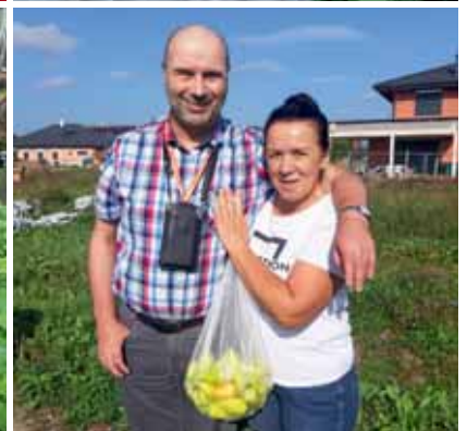
Gründüngung der Hochbeete mit LebensGroß.