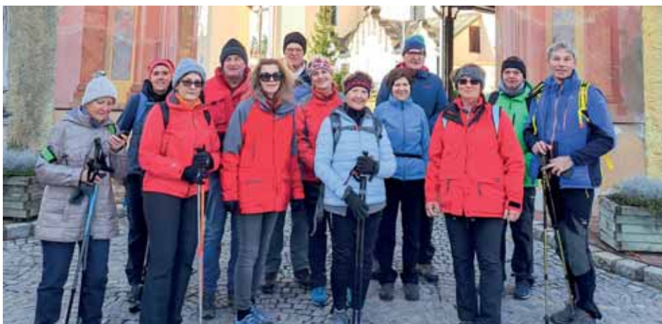
Fußwallfahrt nach Maria Lankowitz.

Das Ganslessen ist in unserer OG auch schon zur Tradition geworden. Ob Martingansl oder Backhenderl, alles war wieder erlaubt, auch Sonderwünsche wurden zu aller Zufriedenheit erfüllt. Zu dieser Veranstaltung haben wir 76 Mitglieder