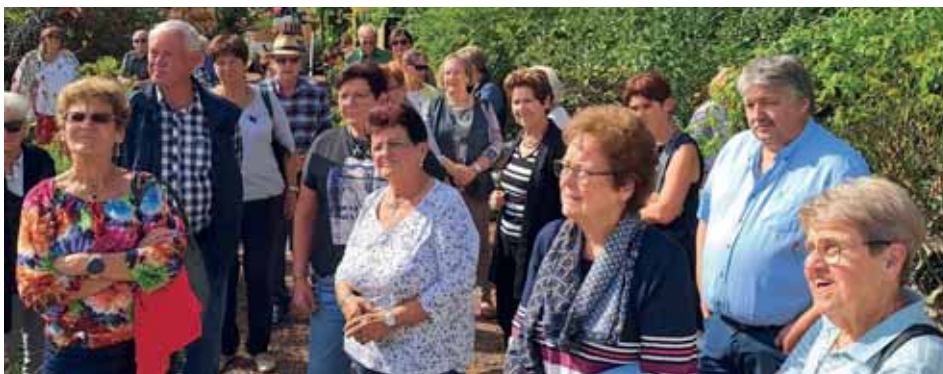
Kräutergarten in Söchau.