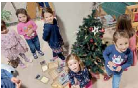
Auch wir haben einen Weihnachtsbaum.