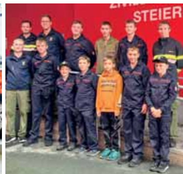
Ausflug in die Landesleitzentrale und die Feuerwehr und Zivilschutzschule Steiermark.