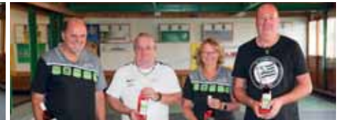
Mannschaftsspiel 2. Gruppe