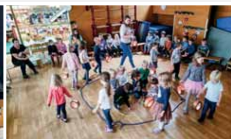
Üben für den Laternentanz.