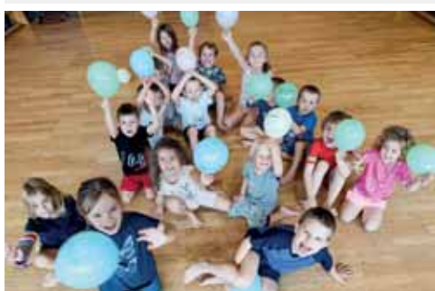
Wir halten uns fit.