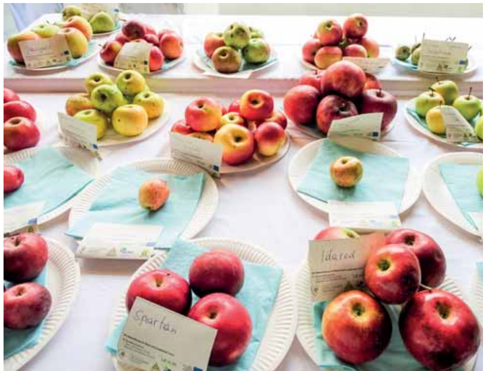
Überblick über die regionalen Obstsorten.