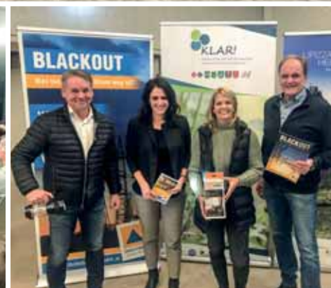
Tag der Mobilität und Versorgungssicherheit vor dem Gemeindeamt Söding-St.Johann.