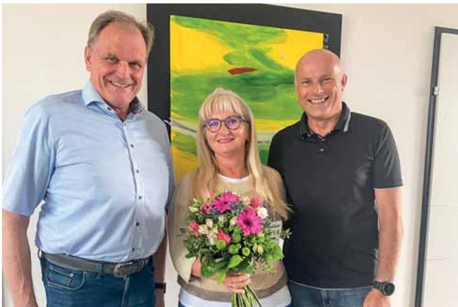
Sonderpreis „Betriebliche Gesundheitsförderung in der Arbeitswelt 4.0“ für Lukmann Consulting.

Die Covid-19-Pandemie hat vieles verändert und beschleunigt, so stellen sich auch in der Arbeitswelt zahlreiche neue Herausforderungen, die von den Arbeitgebern angenommen und von allen gemeinsam – den Mitarbeitern und den Unternehmen – bewältigt werden müssen. Mit dem Sonderpreis „Betriebliche Gesundheitsförderung in der Arbeitswelt 4.0“ wurde diesmal auch den geänderten Arbeitsbedingungen – wie Homeoffice – aufgrund der Pandemie Rechnung getragen. Die Lukmann Consulting lieferte in dieser Kategorie beeindruckende Beweise.