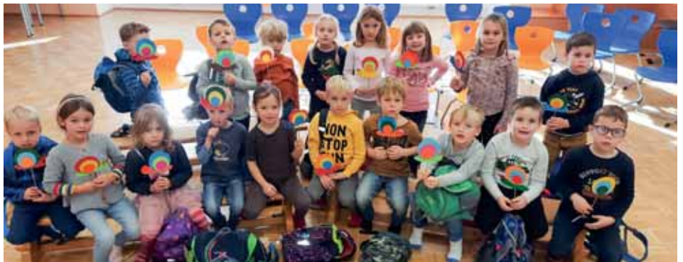
Tag der offenen Klassentür.