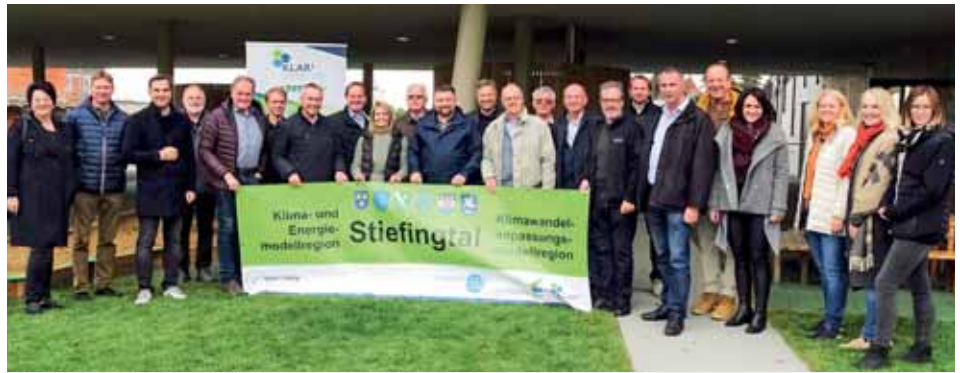
Teilnehmer:innen der Exkursion.