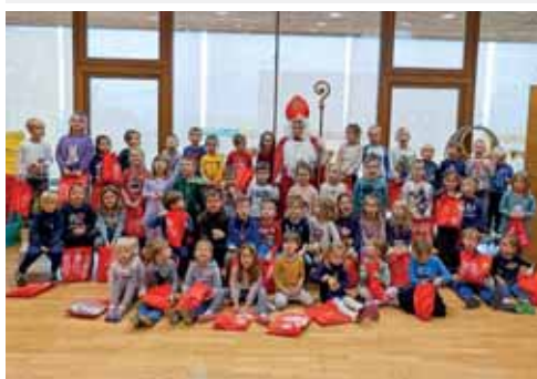
Der Nikolaus zu Besuch bei uns im Haus.