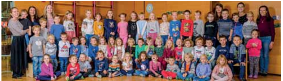
Kindergarten St. Johann ob Hohenburg.

„Strahlend hell und wunderbar, so sei für Euch das nächste Jahr!“ Freude und Besinnlichkeit, das wünschen wir in der Weihnachtszeit!“