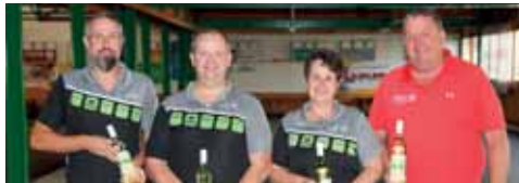
Mannschaftsspiel 1. Gruppe