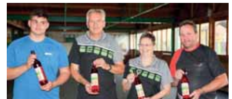
Mannschaftsspiel 3. Gruppe