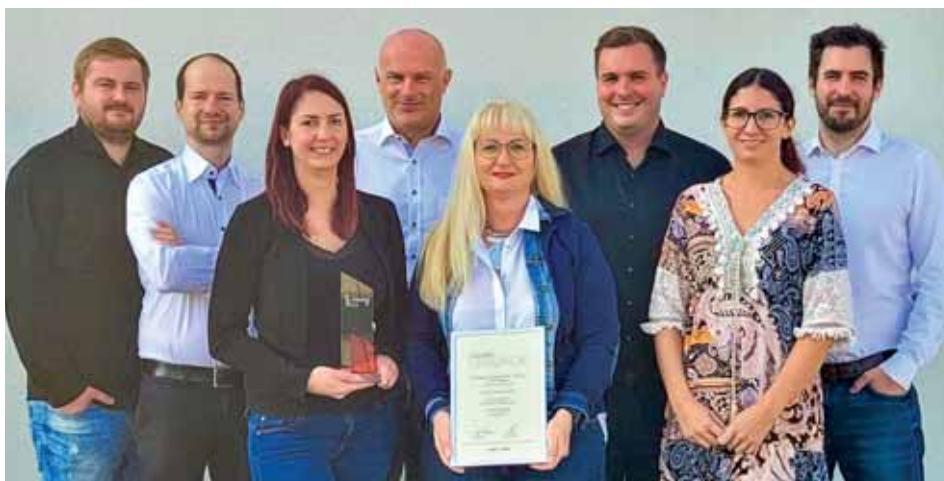
Die Lukmänner und Lukfrauen freuen sich, dass ihr digitaler DSGVO Website Butler ALFRIGHT mit dem eAward 2022 ausgezeichnet wurde.

Der DSGVO Website Butler erkennt mittlerweile über 4.000 verschiedene Cookies, externe Dienste und Consent Tools. Alle