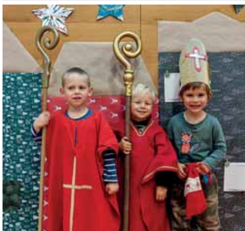
Der Nikolaus ist auch schon da.