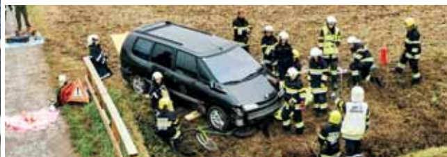
Jugendübung mit drei Szenarien.