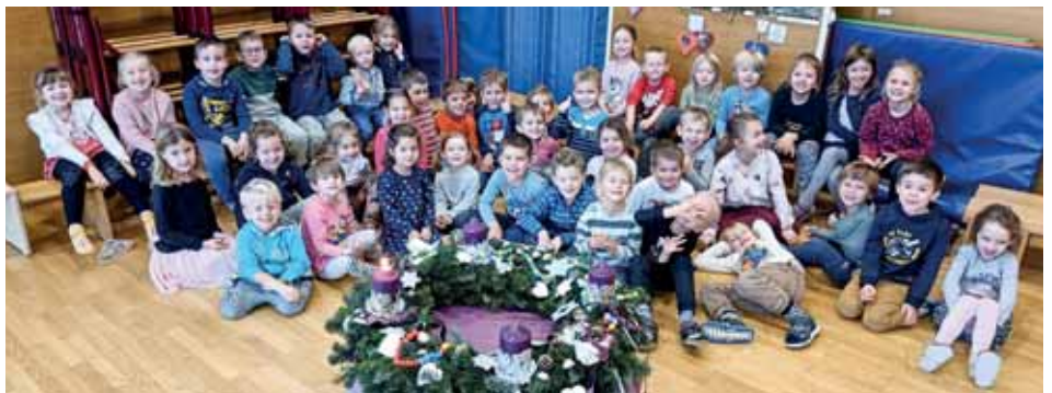
1. Advent im Kindergarten.