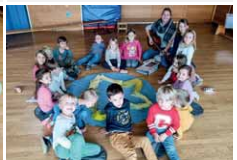
Der kleine Stern.