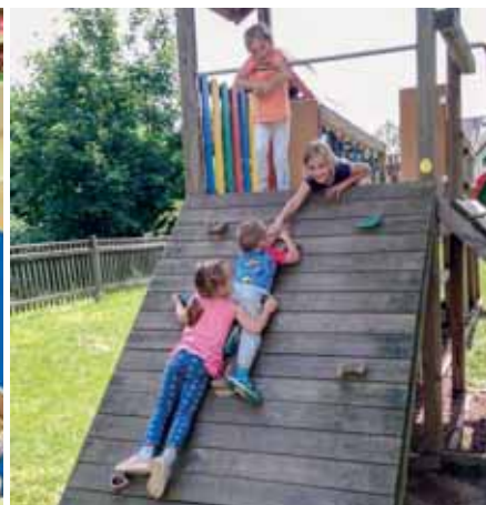
Große helfen Kleinen