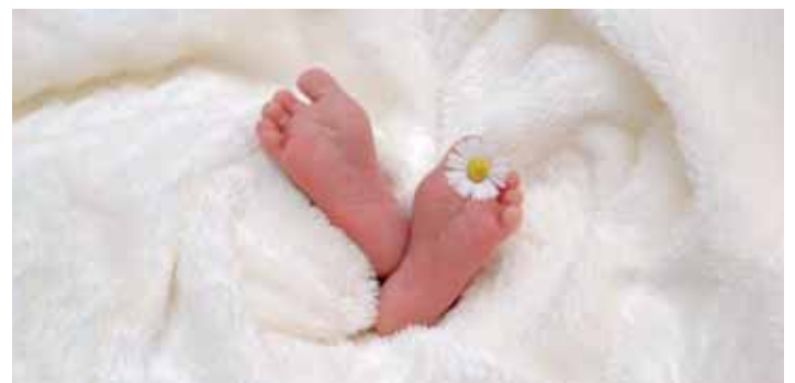
Manches fängt klein an, manches groß, aber manchmal ist das Kleinste das Größte. Herzlich Willkommen bei uns!