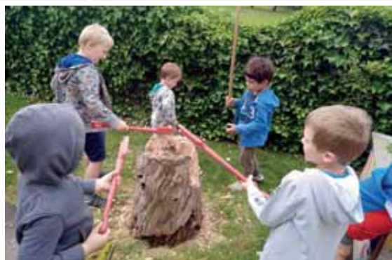
Diesen Baum, „zerlegen wir mit Links“