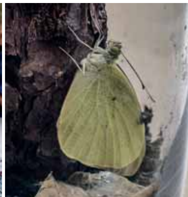
Ein ausgewachsener Kohlweißling