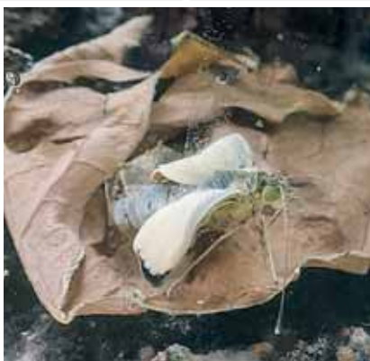
Von der Raupe zum Schmetterling