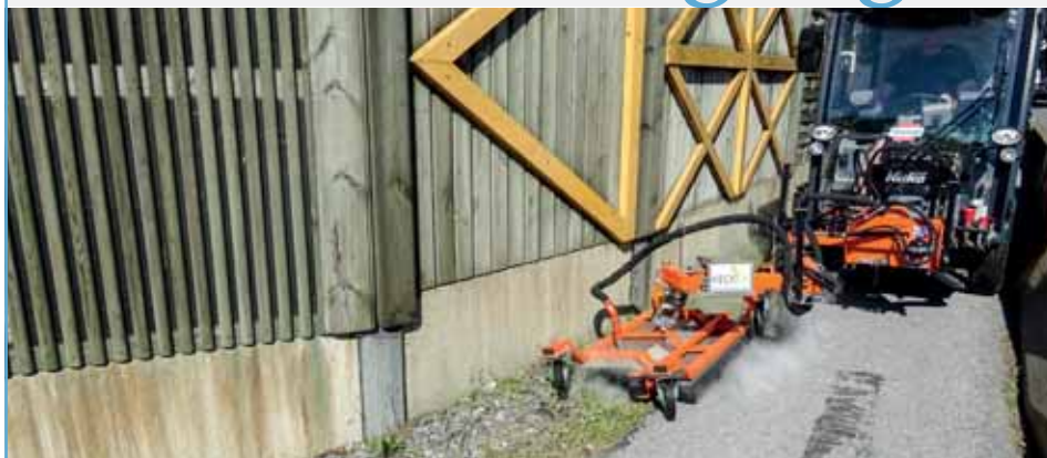
Neue chemielose Unkrautbeseitigung durch Heißwasser