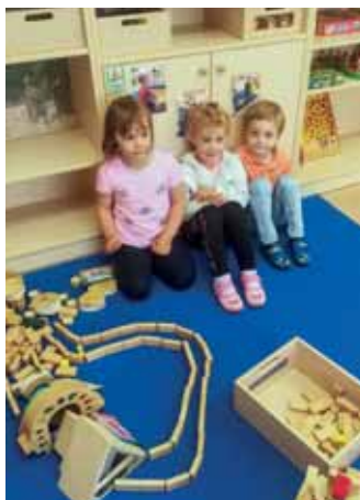
Unser Bauwerk ist fertig