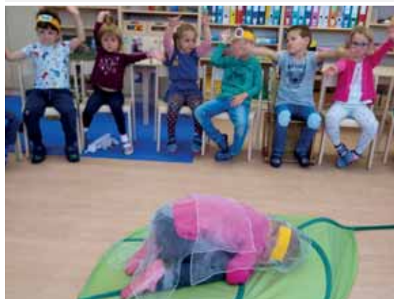
Die kleine Raupe Nimmersatt