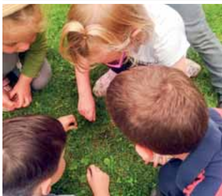
Grille, Grille komm heraus ...