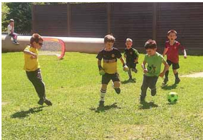
Fussball im Garten