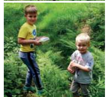
Wissen und Rätseln im Wald