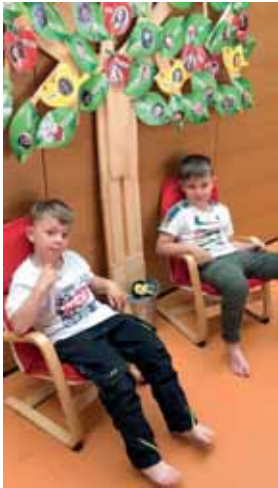
Auf den Freund warten