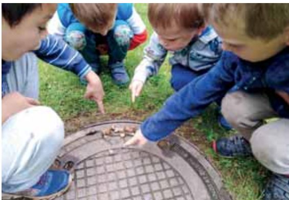
Wir finden Schnecken interessant!

Das Kindergartenjahr ist bald vorbei und damit beginnt für viele Kinder ein neuer Abschnitt in ihrem Leben. Der Übergang in die Schule gehört vorbereitet und trotz der verlorenen Wochen (Corona), versuchen wir gemeinsam mit der Schule es den Kindern so angenehm wie möglich zu machen. Einen Dank auch an alle unsere Eltern, welche in den letzten Wochen, sehr verantwortungsvoll gehandelt haben um ihre Familien und uns zu schützen.