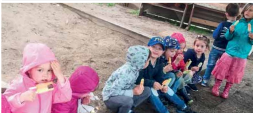
Ein Eis unter dem „großen Regenschirm“