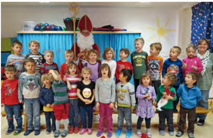
Der Nikolaus in der Regenbogengruppe