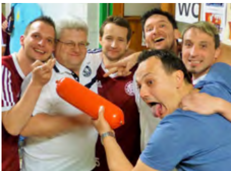
7. Platz: Dream Team Moosing