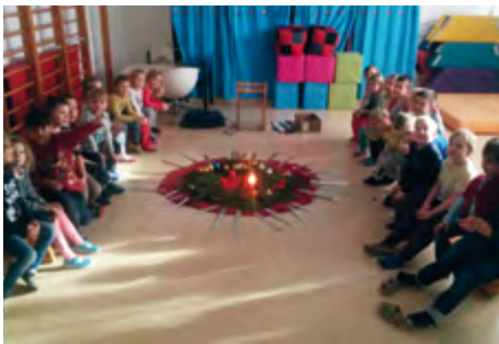
Kinder der Bärengruppe legen einen Adventkranz