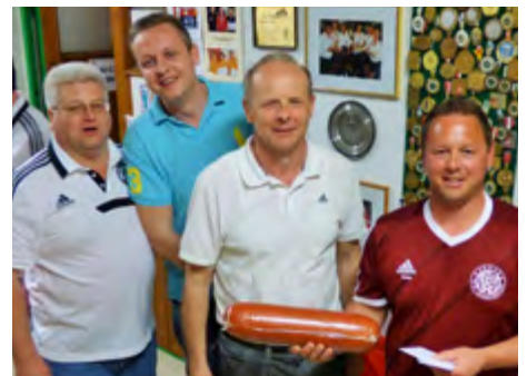
9. Platz: Die Hopfentropfen