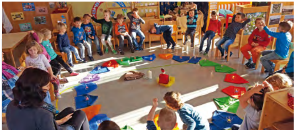
Wir hören die Nikolauslegende

Das Jahr neigt sich dem Ende zu und die Adventzeit beginnt. Für viele eine sehr aufregende und hektische Zeit, umso mehr versuchen wir im Kindergarten, entspannende und ausgleichende Angebote anzubieten. Mit gelegten Adventkränzen, Liedern und verschiedenen Geschichten, stimmen wir uns auf die Weihnachtszeit ein und versuchen den Zauber dieser Zeit zu spüren.