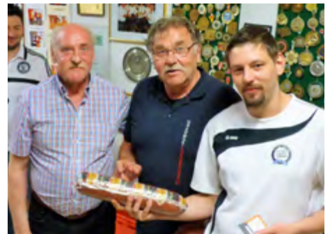
6. Platz: Fischerrunde Nemo