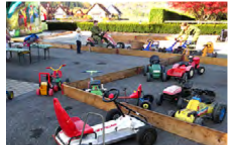
Herbstfest FF Hallersdorf, 23.10.2016