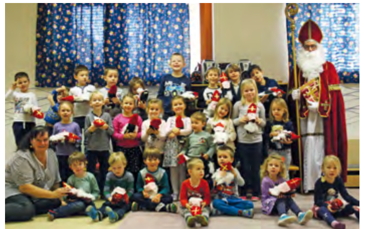
Nikolausbesuch in der Bärengruppe