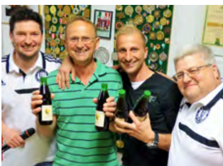
10. Platz: Ismiawuascht