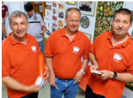
5. Platz: Schnapserunde Schilcherhof