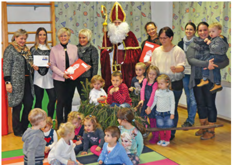
Die Kinder und Betriebstagesmutter der sozKom GmbH und Co KG feierten ein Nikolausfest mit vielen Gästen im „alten“ Kindergarten in St. Johann o.H.

Seit Oktober 2015 haben MitarbeiterInnen der sozKom GmbH und Co KG die Möglichkeit, ihre Kinder von einer Betriebstagesmutter betreuen zu lassen. Die Betreuung findet in den Räumen des „alten“ Kindergartens in St.