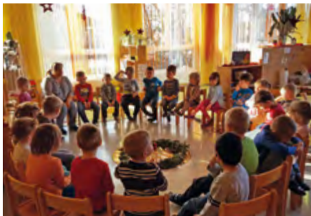
Die Regenbogengruppe beim Legen des Kranzes