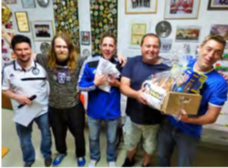
1. Platz: Heli&Friends

geben, denn älter werden wir ja schließlich alle. Es sind alle Gemeindebürger, die Lust am Hobbyfußball und anderen Freizeitaktivitäten haben herzlich eingeladen den Verein beizuwohnen. Künftig soll auch ein Wandertag dem fixen Programm der Altherren angehören. Somit verbleiben wir mit kameradschaftlichen Grüßen und freuen uns schon auf die neue Saison.