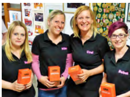
11. Platz: Moosinger Angels