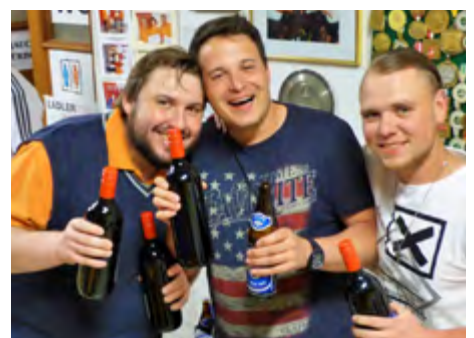
12. Platz: Team Jost