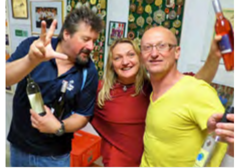
3. Platz: Die Tennisinsel