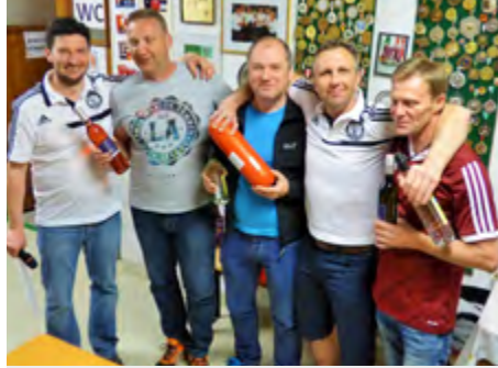
2. Platz: Cafe Sieglinde