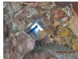
Abb.2: Aluminiumdose in SNP