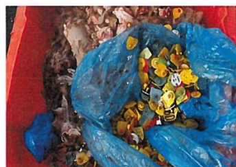
Abb.3: Ohrmarken/Kunststoffsäcke in SNP-Container