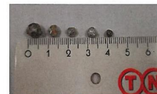
Abb.6: Verschiedene Metalle im Endprodukt

Lebensmittel sind, wenn nicht zu verwerten, der Bioabfall-Sammlung zuzuführen und in keinem Fall in der TKV-Zelle zu hinterlegen.