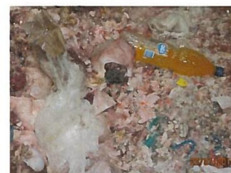
Abb.4: Kunststoffflasche/Kunststoffe in SNP