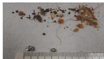
Abb.5: Aluminiumpartikel und Kunststofffasern im Endprodukt