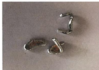
Abb.1: Wurstklips in Rohware gefunden