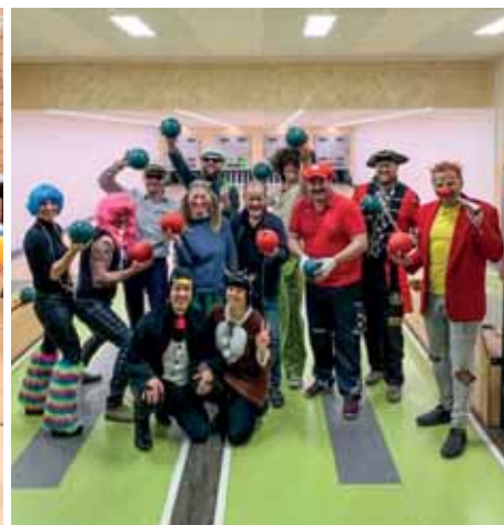
Faschingskegeln beim GH Reisinger