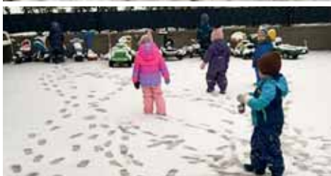
Wir erforschen den Schnee.