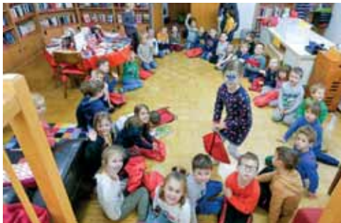
Regelmäßiger Besuch in unserer Bibliothek.