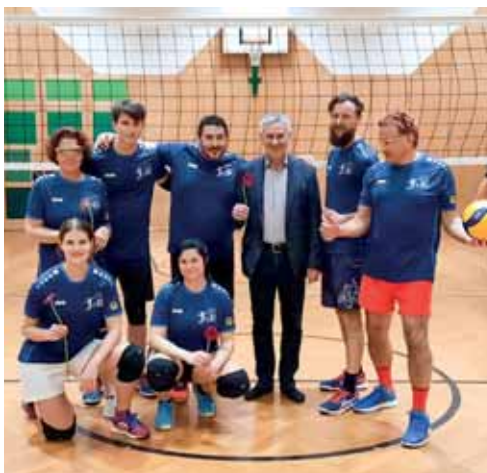
Neue Dressen mit Hauptsponsor Raiba Söding

Alle Neuigkeiten findet ihr auf f / vbcvolleyballsöding