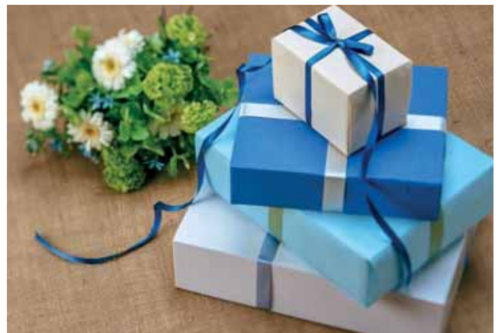
Wir gratulieren recht herzlich!