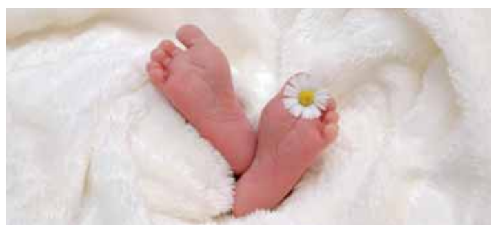
Manches fängt klein an, manches groß, aber manchmal ist das Kleinste das Größte. Herzlich Willkommen bei uns!