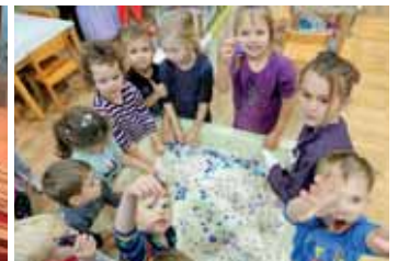
Wir lieben unsere Sensorikwanne.