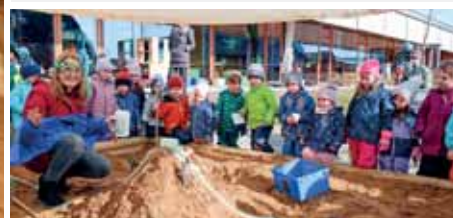
Vulkanexperiment in der Sandkiste.