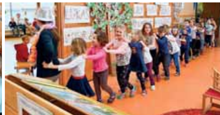
Faschingspolonaise durch den Kindergarten.