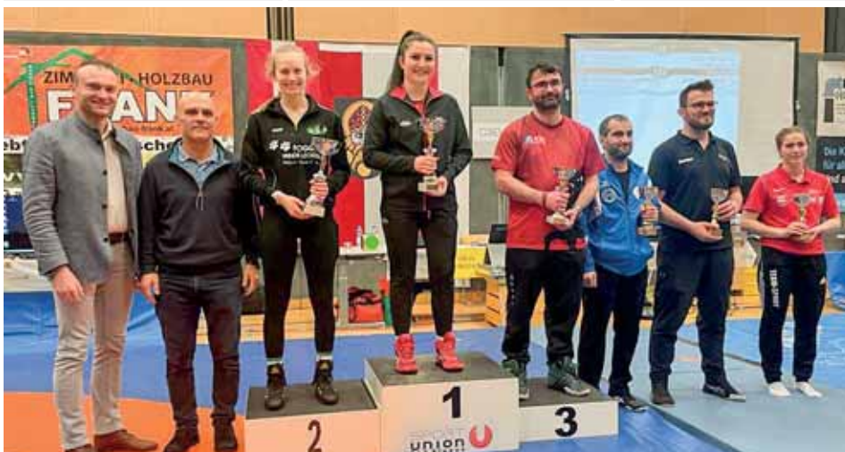
Team Wertung Mädchen