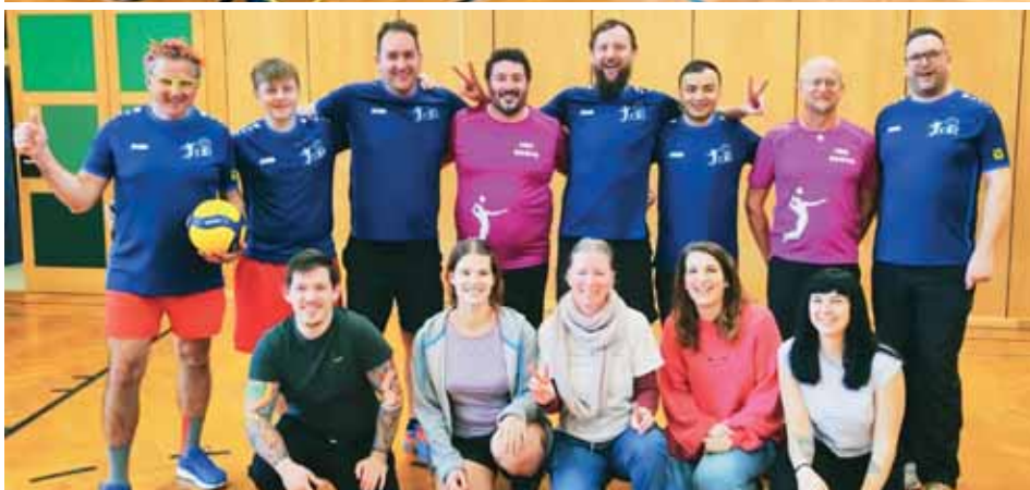
Mixed-Volleyball Hallenturnier „Chili con Volley“.