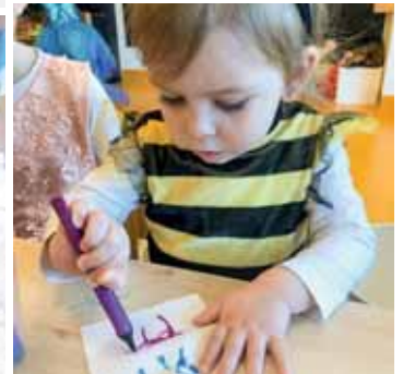
Das bunte Raupenexperiment.