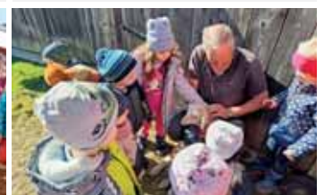
Zu Besuch bei den Schafen.