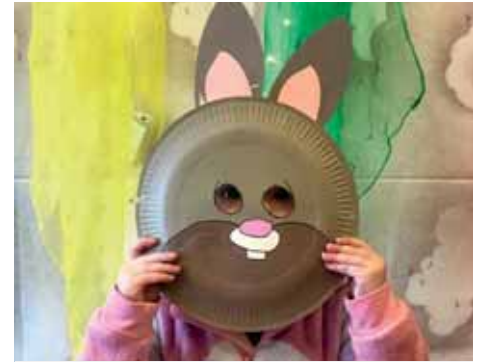
Fotoshooting mit den Tiermasken.

Im Gruppenraum durften die Kinder das bunte „Raupenexperiment“ selber durchführen, auch ein kleines Fotoshooting mit verschiedenen Tiermasken wurde vorbereitet. Um die Fantasie der Kinder freien Lauf zu lassen, durften sie mit Polsterfolie ein Clownsgesicht gestalten. Abgeschlossen wurde der Tag mit einem kleinen Snack, den wir am Vortag mit den Kindern vorbereitet haben: Reiswaffeln mit Joghurt und Smarties.