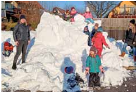
Frau Holle schickte uns Schnee.