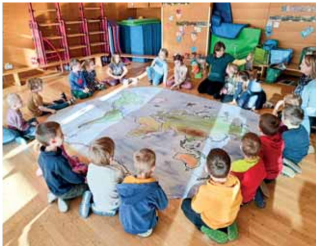
Klimaschutz Workshop mit KliMax.