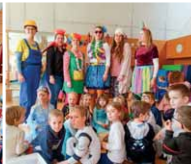
Trara, der Fasching ist da.