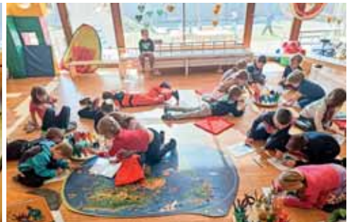
Klimaprojekt mit den Vorschulkindern.