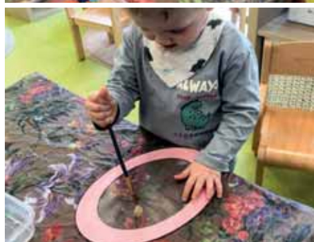
Eier aus Transparentpapier.