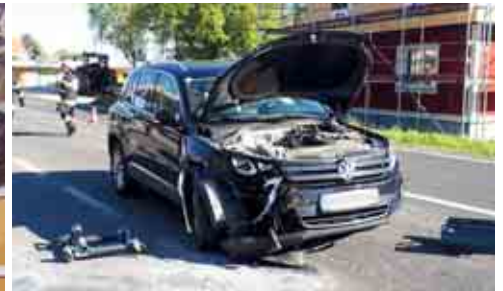
Zusammenstoß auf B70