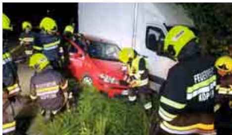
Zusammenprall eines Pkw mit einem Kleinlaster