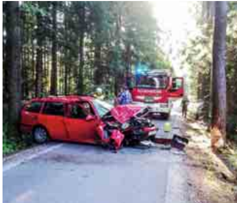
Verkehrsunfall in Grabenwarth

Am 1. August um 04:50 Uhr wurde die FF Hallersdorf per Sirenenalarm alarmiert. Ein Baum blockierte Straße Richtung Grabenwarth. Die Mannschaft war mit Lkw-A und TLF-A unterwegs und konnte