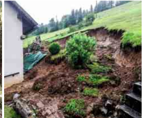
Hangrutschung in Graden

die Fahrbahn bald wieder für den Verkehr freimachen.