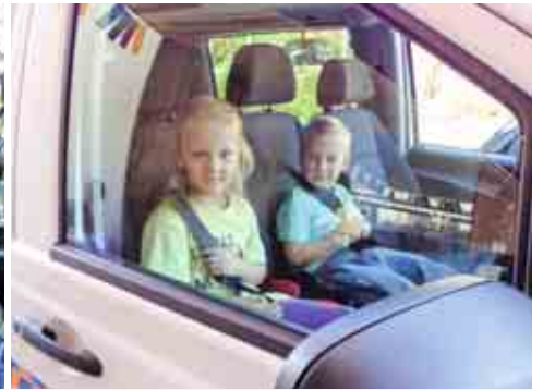
Wir fahren mit dem Bus