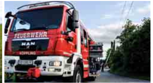
Baumentfernung von Telefonfreileitung