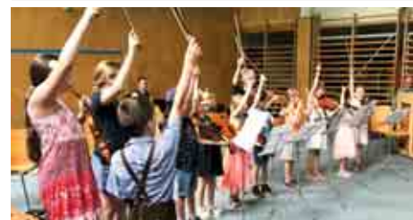
Schlussvorspielstunde Söding-St. Johann