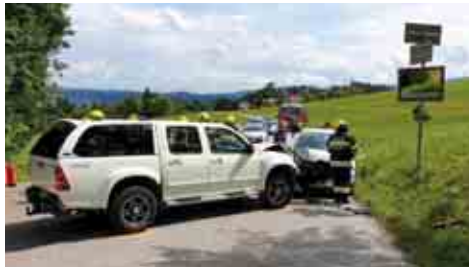
Kollision zweier Pkws Muggaubergstraße

Im letzten Vierteljahr musste die FF Köppling wieder zu mehreren Einsätzen ausrücken. In erster Linie waren es mehr oder weniger schwere Verkehrsunfälle welche die Mannschaft forderten. Es gab Einsätze bei der Kollision zweier Pkws auf der Muggaubergstraße, einem schweren Verkehrsunfall auf der B70 im Bereich der Umfahrung Krottendorf und nach dem Zusammenprall eines Pkw mit einem Kleinlaster auf der B70 in Köppling. Darüber hinaus waren Auspumparbeiten in einem überfluteten Keller in Köppling, die Entfernung eines Baumes von einer Telefonfreileitung und eine Baumbergung in Hausdorf zu bewerkstelligen.