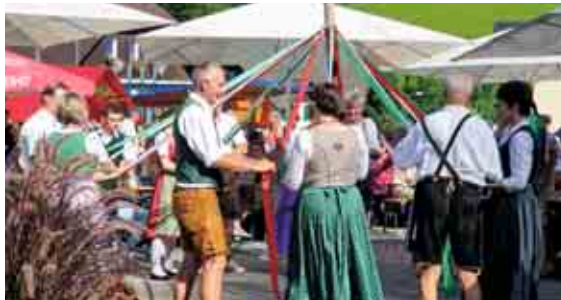
Dorffest in Kainach