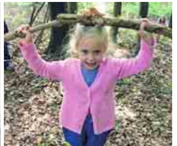
Der Natur auf der Spur