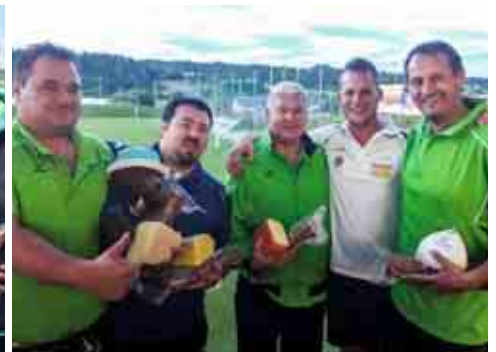
ER St. Peter Honeywell