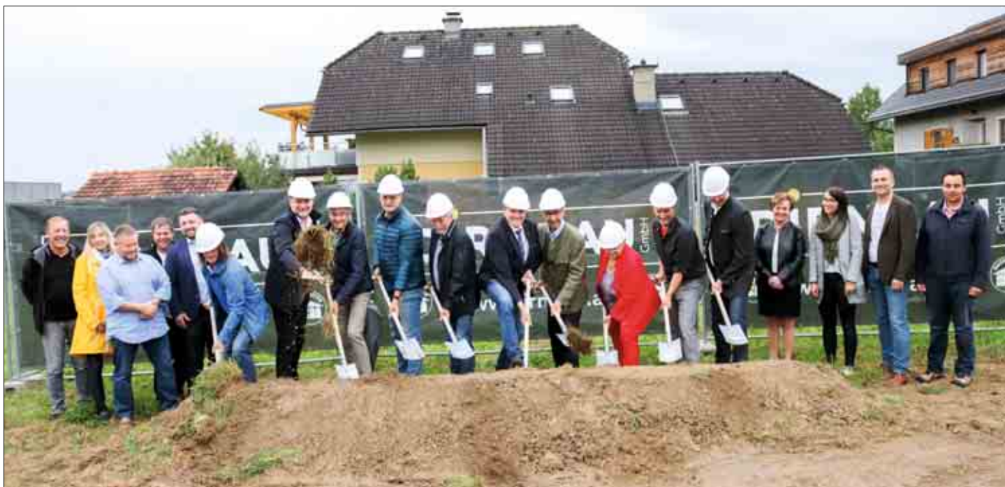
Spatenstich am 23.09.2019 für das neue Gemeindeamt und die Polizeiinspektion

Am 23. September 2019 erfolgte der Spatenstich zum Neubau des Gemeindeamtes und der Polizeiinspektion (siehe Foto unten). Vorausgegangen sind umfangreiche Planungen, ein Ausschreibungs- und Vergabeverfahren, die Bauverhandlung und wasserrechtliche Verhandlungen sowie diverse Besprechungen. Auch einige Besprechungstermine mit der Landespolizeidirektion waren notwendig um das Raumprogramm für die neue Polizeiinspektion abzustimmen bzw. zu fixieren. Leider gibt es noch immer keine schriftliche Zustimmung durch das Innenministerium, es liegt aber ein Entwurf für einen Mietvertrag in schriftlicher Form vor, der auch unseren Vorstellungen entspricht. Im Bauausschuss wurde das Gemeindeamt-NEU in 22 Ausschusssitzungen, vom Architekturwettbewerb über Planung bis zur Vergabe behandelt und in mehreren Gemeinderatsitzungen mussten die notwendigen Beschlüsse für diese Nettoinvestition