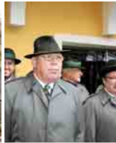
Antreten zur Totengedenkfeier beim GH Hochstrasser