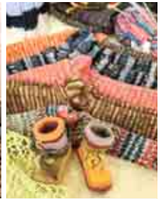
Häkeln, Stricken, ... beim Handwerken im Mooskirchnerhof