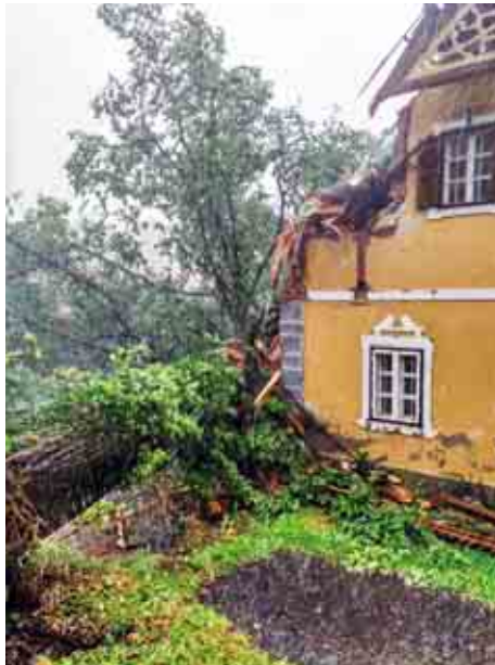
Einsatzserie nach Starkregen

Am 12. September wurde die FF Söding zu einem Auffahrunfall am A2 Zubringer Mooskirchen alarmiert. Der Grund, warum es zum Auffahrunfall kam, ist ungewiss. Eine Person wurde bei dem Zwischenfall leicht verletzt. Sie wurde mit Verdacht auf Schleudertrauma vom Roten Kreuz versorgt und in ein Krankenhaus gebracht. Zur Zeit des Einsatzes war die Sperrung eines Fahrstreifen notwendig. Die Kameradinnen und Kameraden der FF Söding regelten währenddessen auch den Verkehr. Nach der Versorgung der verletzten Person durch die