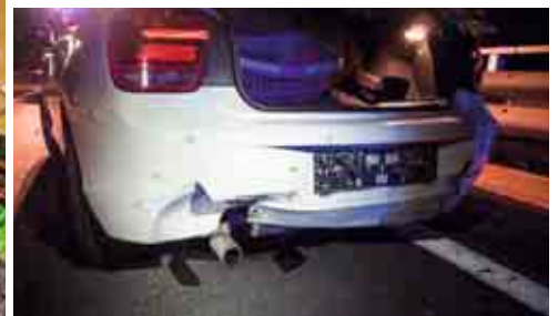
Auffahrunfall am A2 Zubringer

Einsatzkräfte wurden die beiden Unfallfahrzeuge von der Fahrbahn gebracht und anschließend der Verkehr wieder freigegeben.