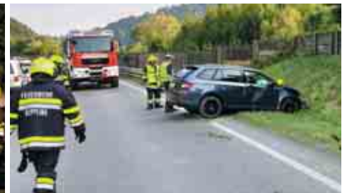
Verkehrsunfall B70 Umfahrung Krottendorf