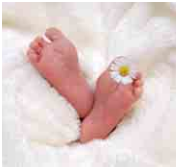
Manches fängt klein an, manches groß, aber manchmal ist das Kleinste das Größte.

Von Mai bis August durften wir folgende neue Erdenbürger begrüßen. Herzliche Gratulation! Wir wünschen alles Gute, viel Gesundheit, Freude & Kraft!